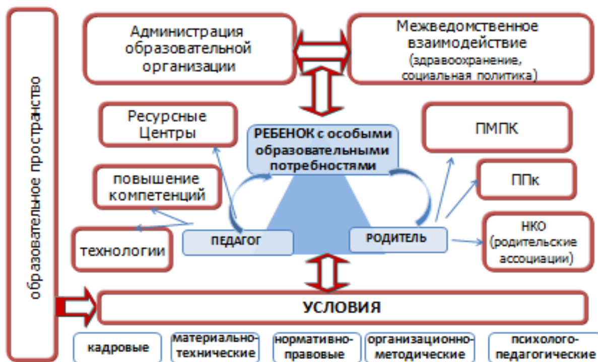
Рис. 2. Модель построения дружелюбной среды в образовательной организации

Модель построения дружелюбной среды в образовательной организации представлена на рисунке 2.