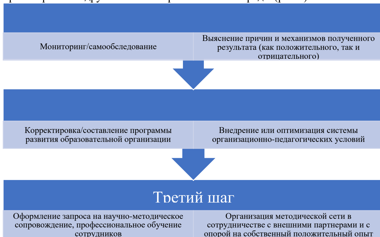
Рис. 1. Цикл принятия управленческих решений, направленных на проектирование дружелюбной образовательной среды.

Рассмотрим цикл принятия управленческих решений, направленных на проектирование дружелюбной образовательной среды (рис.1).